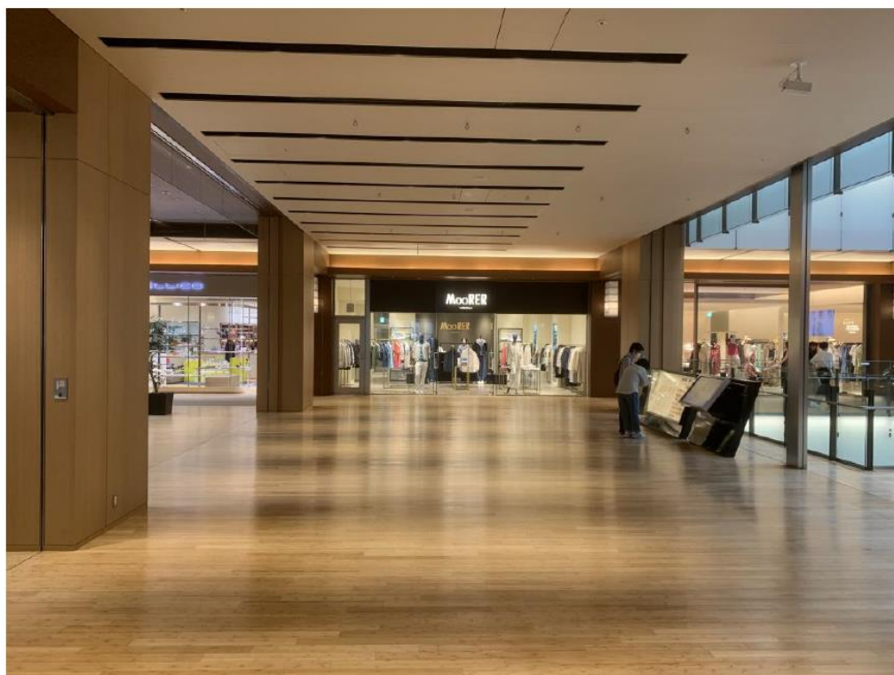
②ガレリア2F中央廊下付近