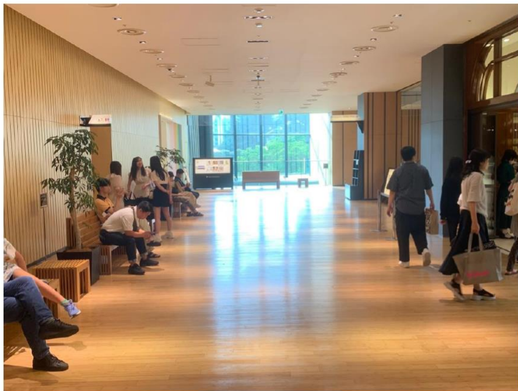
①ガレリア2Fガーデンテラス付近