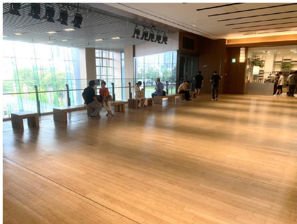
④ガレリア2Fガーデンサイド付近（アトリウム上）